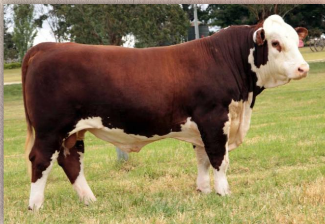
Tycolah Jovial F77 x Bowen Vincent V1

Matthew Rollason, Genetics Support firmy Cogent říká: „Tři měsíce jsem strávil v Austrálii a Mawarra Mustang byl bezpochyby jedním z nejkompexnějších bezrohých býků, které jsem kdy viděl. Jeho otcem je Tycolah Jovial, který byl prodán za 80 000 dolarů. Mustang kombinuje bezchybnou stavbu těla a končetin s původem matky, která pochází z linie vynikající mateřskými vlastnostmi. Jeho potomstvo nikdy neselehává v zanechání skvělého dojmu, vykazují ohromný růst a skvělé utváření beder již od raného věku. Můžete od něj očekávat produkci silných dcer se zdravými a dobře utvářenými vemeny, stejně jako vysoce funkčních synů nabízejících nepřibuznost!“