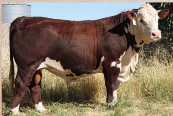
Otec býka Showtime

farmě Mawarra, její první syn Rhinestone byl prodán za 40 000 $. Showtime také patří do nejlepších 10% populace pro mléčnost. Nabízí naprosto kompletní profil plemenných hodnot, což ho v kombinaci s jeho nepřibuzným původem předurčuje k rozsáhlému použití na naší populaci.