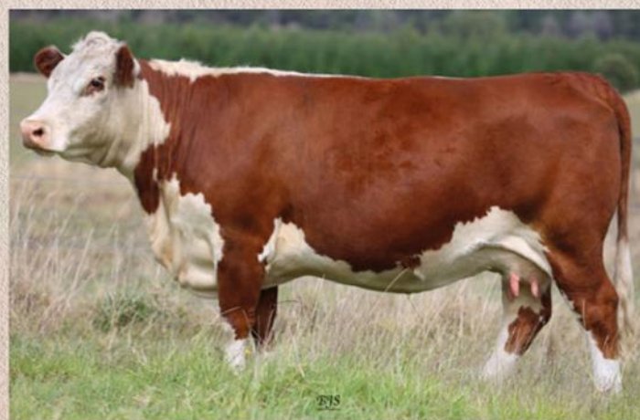
Matka býka Showtime