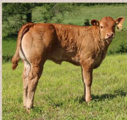
Dcera byka Nelomba