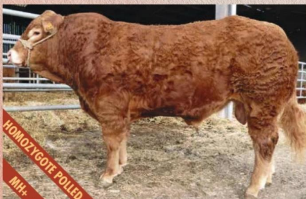
Syn Jodokuse, prodán za 16000 euro