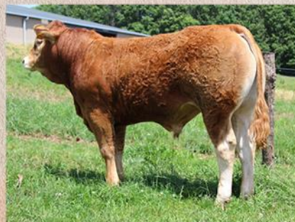
Býček po Importovi