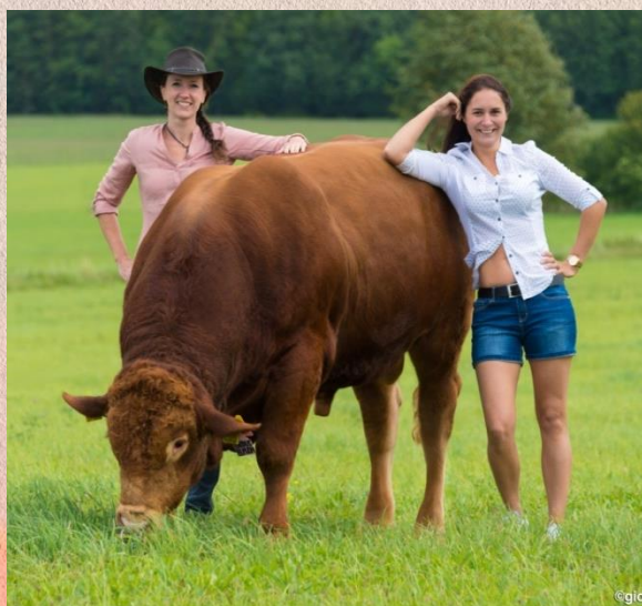
Iltis PP x Vetiver MN