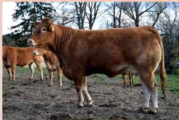
Dcera Astora – březí jalovice