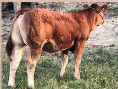
Dcera byka Lorenzo PP