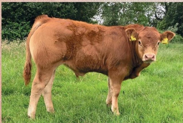
Syn Lega PP

pro porodní hmotnost 132. Jeho telata mají vynikající harmonický exteriér, rychle rostou a vynikají šířkou pánve. Lego pochází z kombinace dvou legend bezrohého šlechtění ( Rex PP x Mateo PP). Jeho matka je velmi dlouhá a hluboká kráva se skvělým výrazem. Vynikající je její mléčnost a utváření vemene. Lego je homozygotem genu F94L, který je označován britskými chovateli jako profit gen.