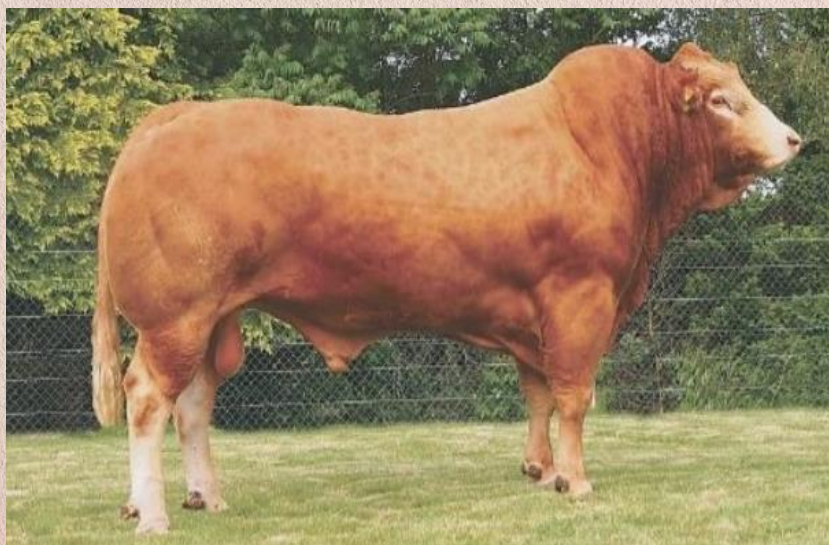
Verdi x Juillascois

Clovis je synem dvou vynikajících rodičů. Jeho otec Verdi je známým několikanásobným šampionem v Paříži, který měl také vynikající mateřské pozadí. Matka Mirza vynikala perfektní mléčností a homogenní produkcí, poslední tele dala v 15 letech. Potomstvo Clovise je smíšeného typu, které vyniká šířkou, vynikající pávní a skvělým osvalením. Dcery Clovise jsou mohutné krávy, snadno se telí a jsou nadprůměrně mléčné. V jeho rodokmenu není žádný inseminační býk, tudíž se jedná o relativně nepřibuzného býka. Clovis má všechny předpoklady pro produkci výstavně úspěšného potomstva, které bude velice úspěšné a funkční v dalším chovu.