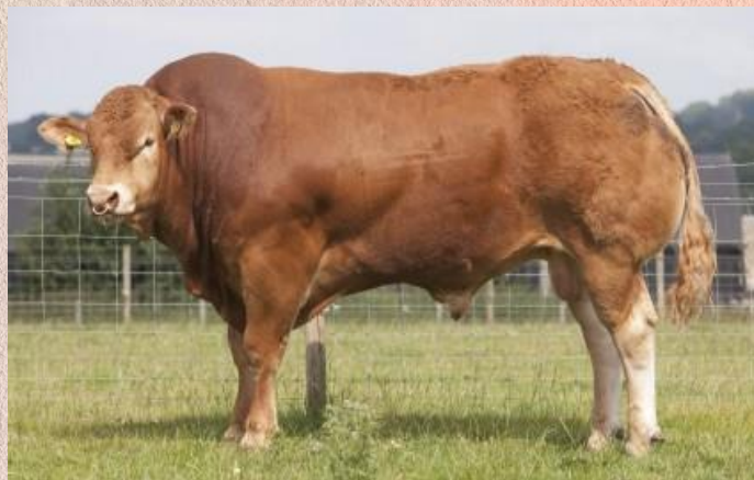
Wilodge Vantastic x Sympa

Fastrac je produktem vynikající kombinace Wilodge Vanatastic x Sympa, která je zárukou úspěchu. Potomstvo Fastraca je velkého tělesného rámec a je skvěle osvalené a dlouhé. Jeho dcery nemají problém s mléčností a produkují velmi zajímavé potomstvo s bezrohými býky.