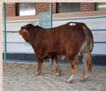
Syn Induse - 79 bodů za exteriér

Indus je vnukem vynikajícího býka Index PP, jehož potomstvo v Německu vyniká excelentním osvalením. Otcem matky Induse PP je francouzský inseminační býk Vetiver. Ve Francii i v Česku má snadné porody a vynikající mléčnost. Indus PP kromě 100% bezrohého potomstva, nabízí i naprosto výjimečnou kombinaci původu, nepřibuzné německé genetiky s rohatým prověřeným francouzským plemeníkem. První telata po Indusovi vynikají svým osvalením, především žádě a výbornou růstovou schopností, velice snadno se telí.