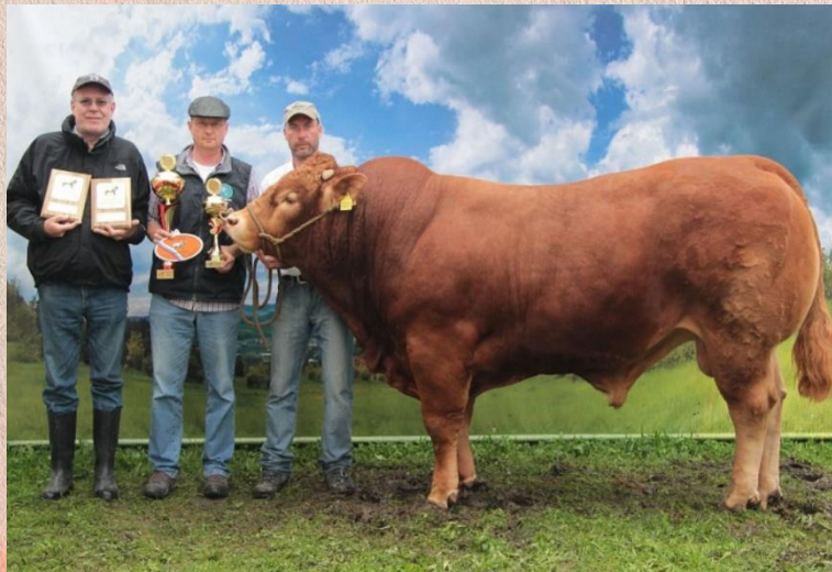
Armstrong x Nightflyer

Abidol absolvoval velmi úspěšně výstavu Země Živitelka v Českých Budějovicích 2014, kde nenašel žádného konkurenta a získal titul národního vítěze v kategorii býků do třech let a ve finále i absolutního šampióna Limousine show. Jeho otec, francouzský plemeník Armstrong byl široce inseminačně využíván i v Německu. Matka Armstronga má skvělé liniové vedení: Melodie – Nenuphar – Malibu – Ontario a patří k nejlepším kravám Klemmova stáda. ABIDOL splňuje všechna přání limousinských chovatelů. Zbarvení, super končetiny, vysoké osvalení a klidný charakter. Býk vážil v září 2014 1040 kg a v kříži měřil 152 cm. Lineární hodnocení zevnějšku dosáhlo excelentních 92 bodů. ABIDOL byl zakoupen společností NATURAL na aukci nedaleko Lipska za rekordní cenu 10 500 EUR.