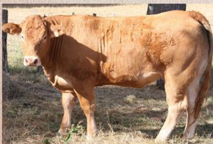
Dvouletá jalovice po Lorenzo PP