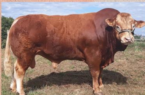
Syn Importa výstavní šampion Malibu