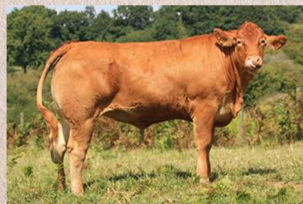
Dcera Lorenza 2 roky stará