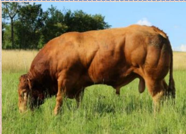
Moskito P x Dauphin