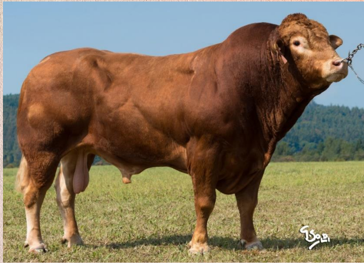
Mateo PP x Imperator vom Eiderland P

Mats PP se narodil v chovu pana Wählera v německém Reichstädtu. Mats přirůstal v testu 1 550 g denně. Při základním výběru byl ohodnocen 73 body. Otcem Matse je Mateo PP, který je též v naší nabídce a vyniká excelentním potomstvem a skvělou genomikou. Mateo PP je též velmi využíván ve Francii, kde má více než 900 potomků. Otcem matky Matse PP je kráva Hauteur 5 PP, která patří v chovu pana Wählera k nejlepším. Mats je v současnosti sedmiletým býkem. Je to býk velkého tělesného rámce se solidním osvalením s velmi dobře funkčními končetinami. Je již vysoce prověřen na snadné telení.