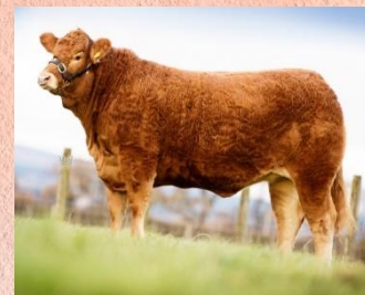
Dcery Hinze PP