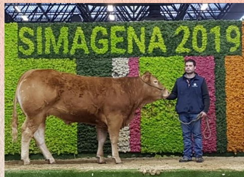
Dcera býka Gauloi Eba na výstavě SIMAGENA 2019 v Paříži