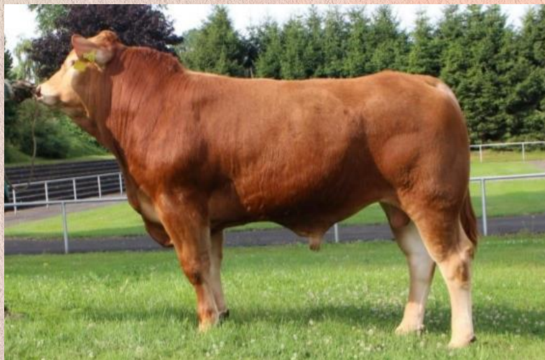
Anton P x Vetiver MN

Aron by mohl být velice dobrou náhradou za býka CN Rex PP, jehož dávky již nejsou k dispozici. Vynikající je jeho růst (známka 10), osvalení (známka 9) a zároveň má velmi snadné porody (známka 9). Nadprůměrná je i jeho mléčnost. Aron zlepšuje šířku, délku a tvar pánve, lze předpokládat, že jeho dcery se budou snadno telit. Jeho matka, která je dcerou mateřského býka Vetiver MN, je typová kráva s vynikající mléčností a výborně utvářeným vemenem.