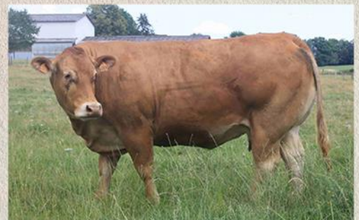
Dcera Importa 3 roky stará