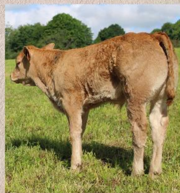
Potomstvo byka Nelomba