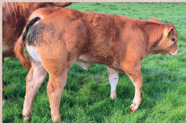
Syn Lega PP