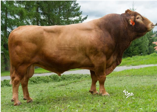
Zako na stanici v Hradištku, třináctiletý

Mezinárodně intenzivně využívaný býk pro svou genetickou bezrohost. Býk vyniká velkým tělesným rámcem a extrémní délkou těla při zcela pevném hřbetu. Potomstvo je rámcové. Zako je doporučen jako levná cesta k bezrohosti ve stádě. Připaruje se na krávy, které jsou dobře osvalené a potřebují zvětšit rámec. Jeho dcera Kačenka chovatele Pavla Kačírka je významnou matkou byků, šampionkou výstav a dárkyní embryí.